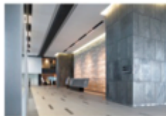
view A 9Fスカイロビーでエレベーターを降り左手 [TULLY'S COFFEE] 方向に進みます。