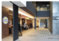
view B [TULLY'S COFFEE] 右手のカンファレンスルーム専用エスカレーターで10Fへ。