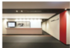
view D カンファレンスルーム専用エスカレーターを上ると左手に受付があります。