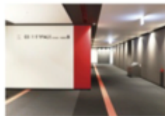
view C 駅からカンファレンスルーム専用エスカレーターで10Fへ。